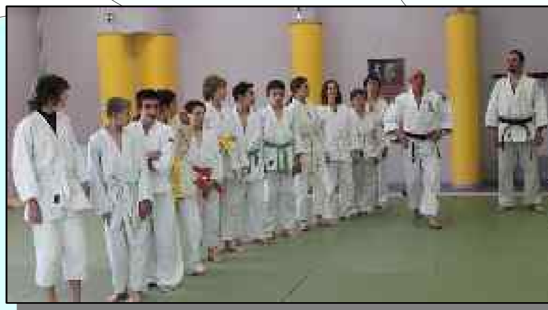
Promotions au club de judo de l'Amicale Laïque